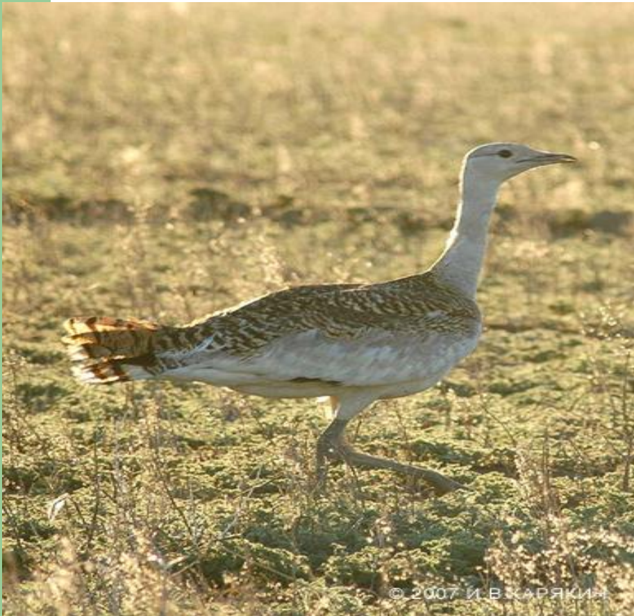
Дрофа 16 – 18 кг