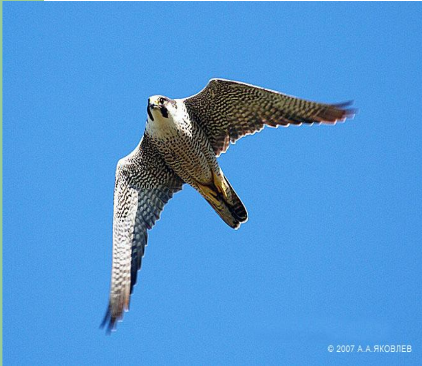
сокол - сапсан