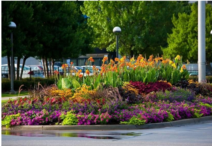
Миксбордер с использованием многолетников

Выбор растений для миксбордера Основу миксбордера составляют, как правило, многолетние растения. Они могут сочетаться с кустарниками и луковичными, нередко дополняются разнообразными однолетниками. Кустарники, используемые в таких композициях, чаще всего обладают яркими декоративными особенностями. Это может быть раннее цветение (форзиция, миндаль), или яркая осенняя окраска листьев (боярышники, бересклеты), или выразительные плоды (снежноягодник, калина), или необычная цветная кора (дерен белый Sibirica )