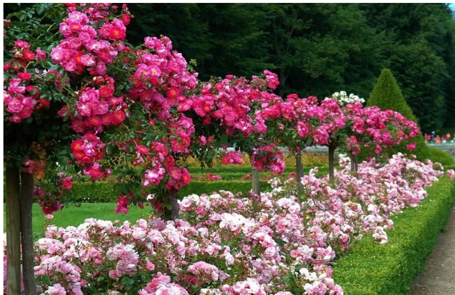
Миксбордер в розовых тонах

подборе составляющих. Однотонный бордюр бывает построен на различных сочетаниях оттенков цвета – в этом случае, к примеру, ярко-жёлтые цветы вы можете дополнить жёлто-оранжевыми, кремово-жёлтыми, лимонными.